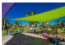
L'Auberge de jeunesse Poé